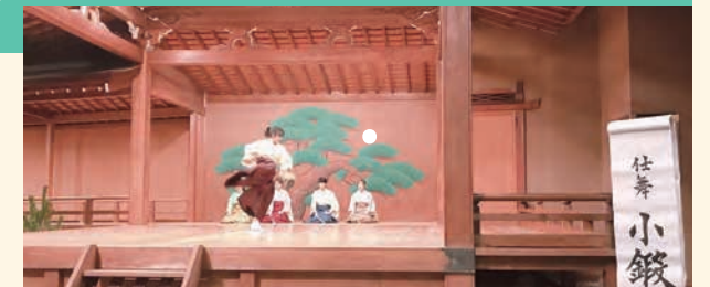
クラブ(能楽宝生会)活動の様子

学修・生活支援課は、履修相談・奨学金相談など学生への総合案内的な窓口対応を行うため、昨年10月の事務機構変更により誕生した新しい部署です。学生が意欲的に学び、安心かつ充実した学生生活を送れるよう学生に寄り添った支援を行っています。今年度は、新型コロナウイルス感染症の影響により学生達が登校できない状況となりました。そのため、遠隔授業を実施することとなり、遠隔授業の受講に必要な機材の用意が難しい学生へはパソコンやルーターの無償貸与を行い、manabaやZoomなどを使用した遠隔授業を実施してきました。