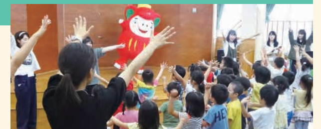
現地保育園で市花「椿」について発表の様子(復興支援学生ボランティア委員会)

また、6月には福島県本宮市にて農業体験、8月には新潟県佐渡市にて伝統芸能体験(鬼太鼓)、9月には同じく新潟県佐渡市にて佐渡能合宿を行いました。学生の主体的な活動であるプロジェクト活動も活発に行われました。「復興支援学生ボランティア委員会」と「女性のはたらき方研究プロジェクト」は9月と2月にそれぞれ岩手県大船渡市と福岡県糸島市にて活動、「本宮SMILEプロジェクト」は福島県