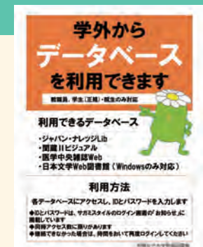
学外データベース利用案内